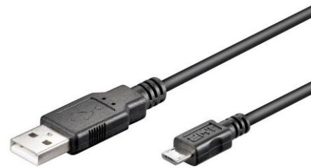
USB - Micro USB -kaapeli