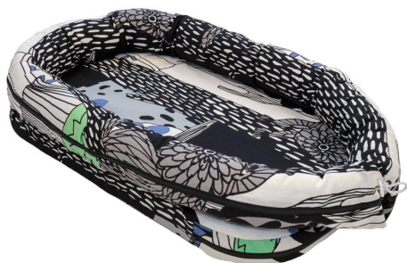
Nucu babynest (tilläggstjänster)

Kontrollera att förpackning innehåller följande delar: