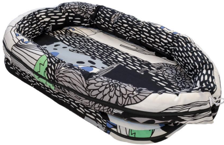
Nucu baby nest

Kontrollera att förpackning innehåller följande delar: