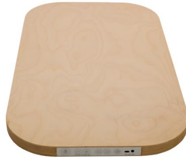
Nucu plattform (inom bottendelen av baby nest)